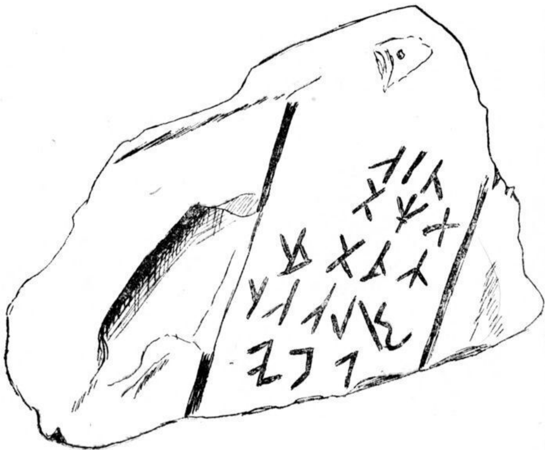
FIG. 5. — Inscription de Bunesti, placée au revers de la sculpture représentant une tête.

Il est bien évident, en effet, que les raisons sur lesquelles M. van Gennep étayait son opinion ne sont pas valables. « Sur l'animal, écrivait-il, l'inscription est à l'envers. » Comment reconnaître le sens d'une écriture dont on ignore l'alphabet-type et la valeur des signes? Et serait-elle à l'envers que cela ne signifierait nullement qu'elle n'est pas contemporaine!