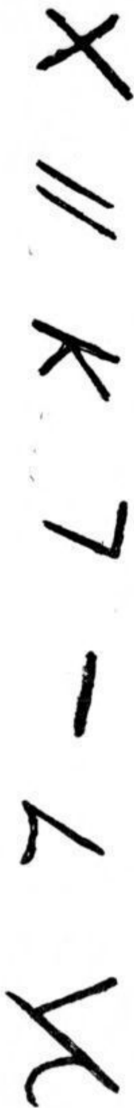
FIG. 3. — Inscription sur tesson provenant des fouilles de M. Tafrali à Cosesti.

M. A. van Gennep se méprend, écrit M. Tafrali, lorsqu'il prétend que ces inscriptions « ont été faites après coup, sans rapport avec les êtres représentés ».