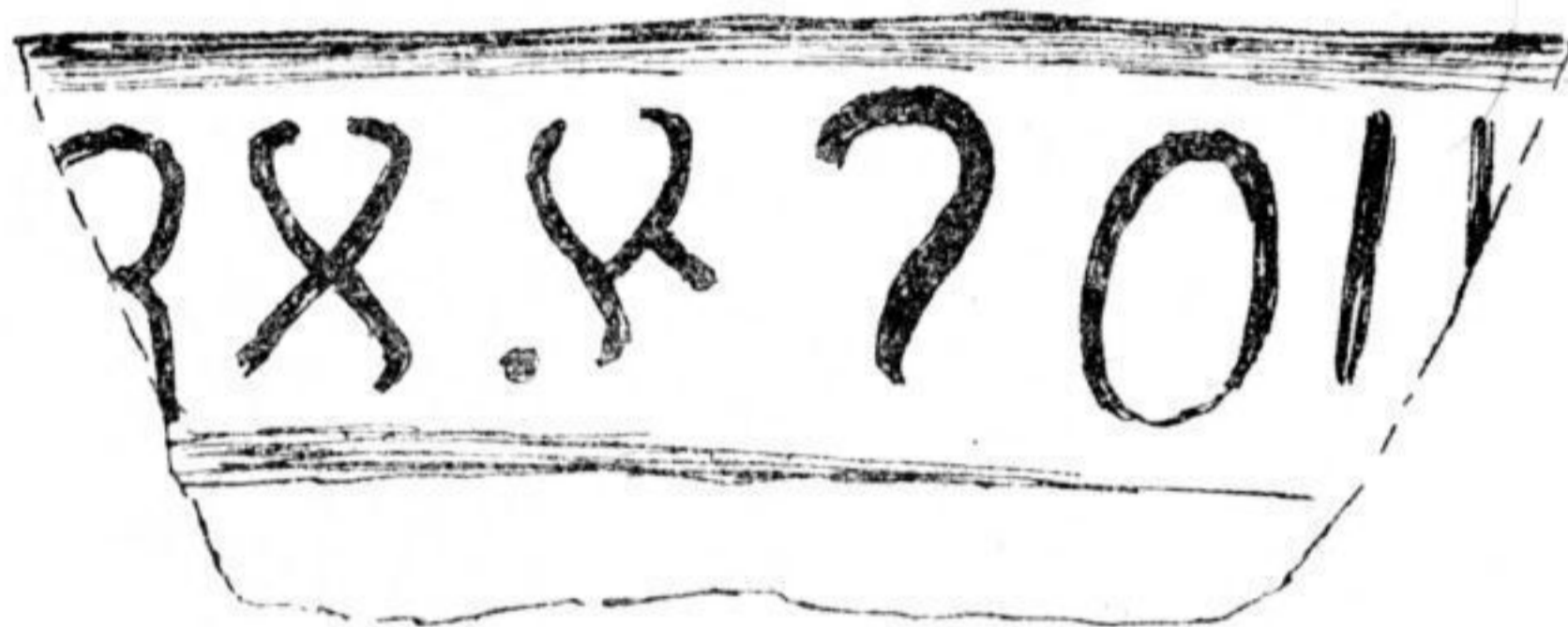
FIG. 1. — Première inscription de Cosesti.

1° Un tesson (0 m.085 × 0 m.035 × 0 m.004 — 0 m.01) portant une inscription (fig. 1).