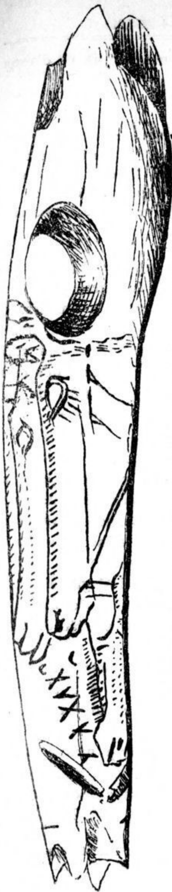
Fig. 1. — Dessin de grandeur naturelle, fait d'après le moulage adressé par M. Carballo au docteur Morlet.

ficiellement après la soumission des clans à une autorité centrale.