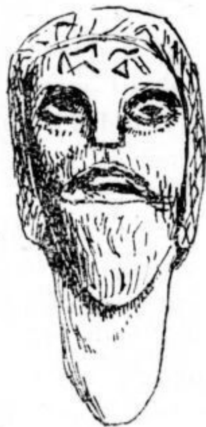
Fig. 1. Homo glozeliensis , vu de face.

La lèvre supérieure apparaît à peine, cachée par une forte moustache, dessinée par un demi-cercle en léger relief, couvert de petits traits ver-