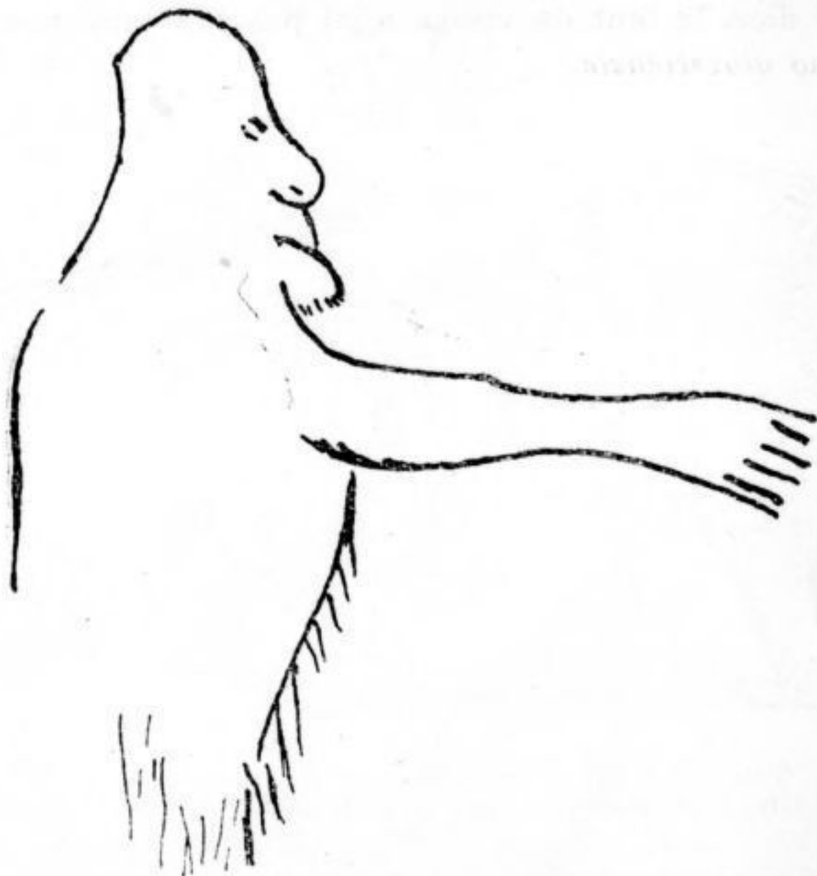
Fig. 3. — L'Homme de la Colombière (d'après L. Mayet).

tics. La lèvre inférieure au contraire est fortement sculptée au-dessus d'une barbe épaisse et taillée en pointe arrondie, comme celle de l' Homme de la Colombière , découvert par le Professeur L. Mayet (fig. 3); tandis que, vue de profil, cette barbe ap-