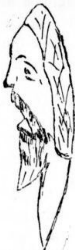
Fig. 2. - Homo glozeliensis , vu de profil.