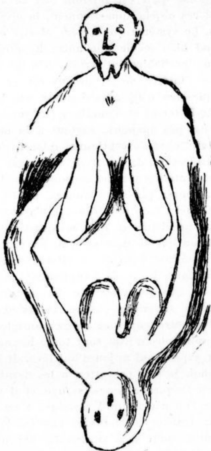
Fig. 5. — Bas-relief de l'abri de Laussel (d'après Wilke).

Cusset vient de rendre une ordonnance de non-lieu. Les réquisitions remises par le procureur de la République au juge d'instruction