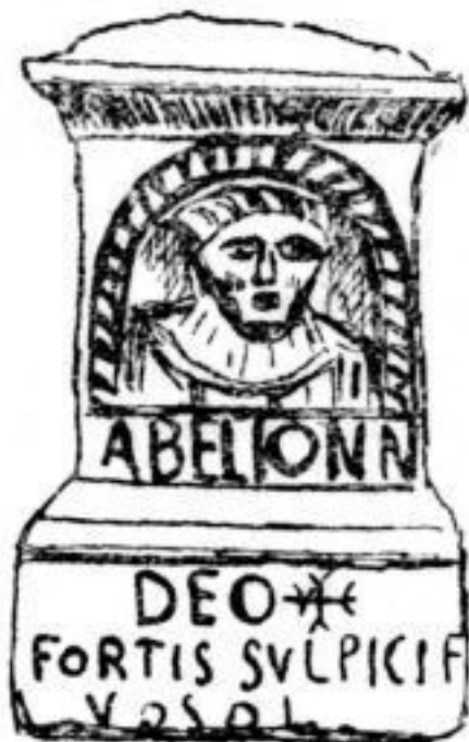
Autel du dieu Abelio.

M. Champion a-t-il jamais regardé (n° 18.726 du musée de Saint-