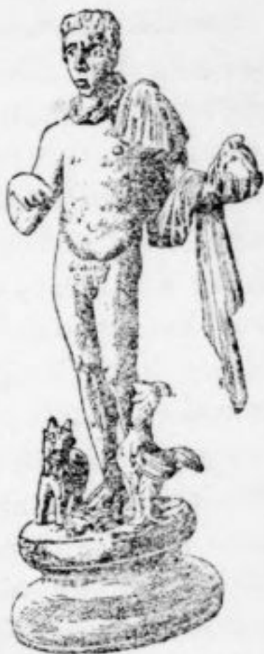
MERCURE. Musée de Saint-Germain (d'après S. Reinach, Bronze , p. 68).