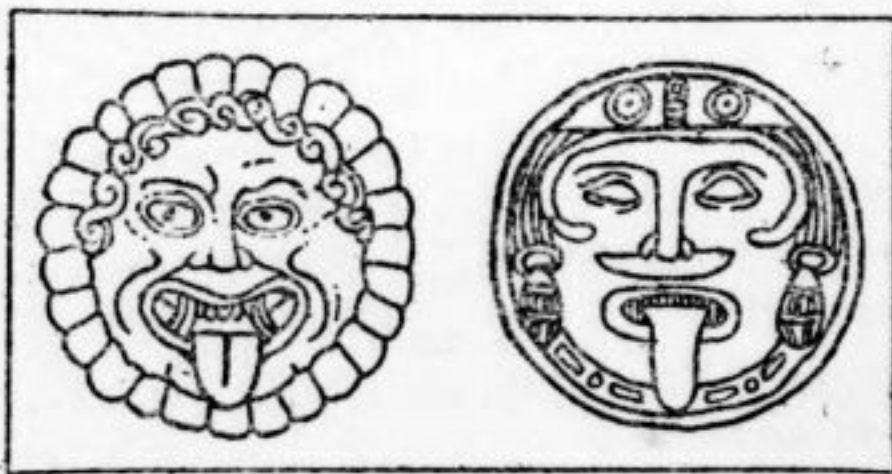
GORGONE ÉTRUSQUE et GORGONE MEXICAINE (Grav. extraite de l' Atlantide de Roger Dévigne.)

Signalons, à ce propos, un nouveau rapprochement entre les symboles antiques du continent européen et ceux de l'Amérique centrale, rapprochement derrière lequel nous pouvons sans doute trouver encore l'Atlantide. Il s'agit de la Gorgone étrusque et de la Gorgone mexicaine, si semblables qu'il est impossible de ne pas leur attribuer une origine commune (18). Or, ces Gorgones sont caractérisées par ce détail que l'une et l'autre ont la langue allongée hors de la bouche ; c'est là un rapprochement avec Ogmius et avec les captifs enchaînés à sa langue. La langue est l'instrument de la parole. Ces deux Gorgones sont donc en réalité des préfigurations du Verbe.