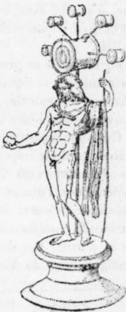
Dieu au maillet de Vienne (Isère). (Sal. Reinach, Bronzes figurés , p. 175.)

En vertu d'une autre loi linguistique peu connue, celle de l'antinomie, au mot Logos , qui veut dire parole dans le sens de vérité , s'oppose le mot germanique lugen , qui signifie mentir . Remarquons que ce renversement de sens