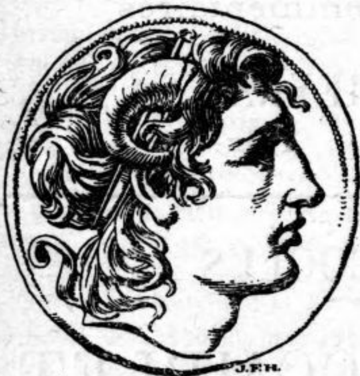
ALEXANDRE LE GRAND.

Un chef-d'œuvre écrit par un maître souverain dans l'art d'être intéressant. M. Wells a rendu un grand service à l'éducation humaine en écrivant cette admirable Esquisse de l'Histoire Universelle .